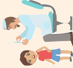
График вакцинации ребенка

Статистика, вакцины, рекомендации, ваш личный график